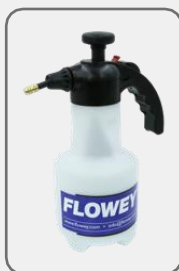
50053 1,25 l