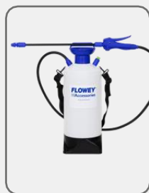
50054-10C 10 l