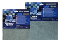
A1 MIKRO KRPE 40X40cm A2 MIKRO KRPE 50X70cm

Temeljito operite vozilo, vendar površine ne osušite. HYBRID CERAMIC SPRAY 3IN1 razpršite na mokro površino, nato pa jo obrišite s čisto mikro krpo, kot je krpa A2 znamke FLOWEY®.