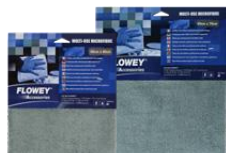
A1 MIKRO KRPA 40X40cm