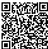
A2 MIKRO KRPA 50X70cm