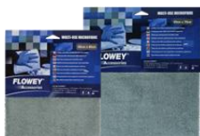
A1 MIKRO KRPE 40X40cm A2 MIKRO KRPE 50X70cm